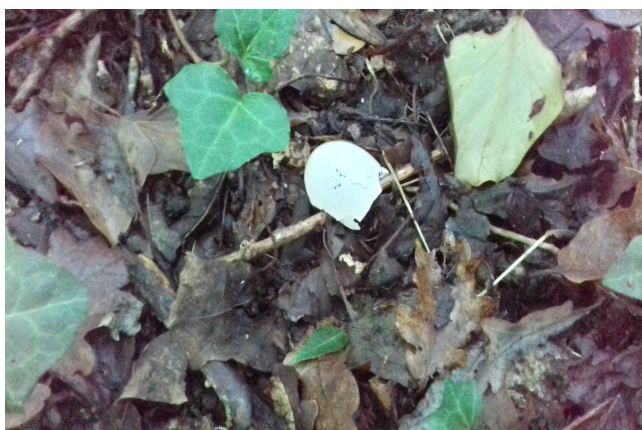
une coquille d'oeuf tombée du nid