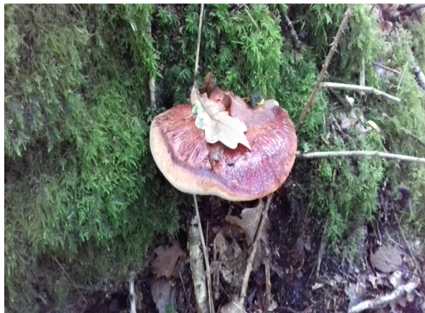
un autre champignon