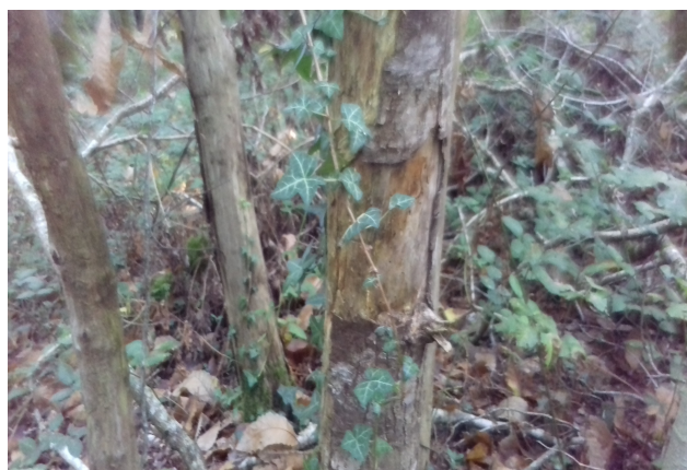
du lierre qui pousse le long d'un arbre