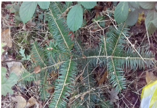
un petit sapin